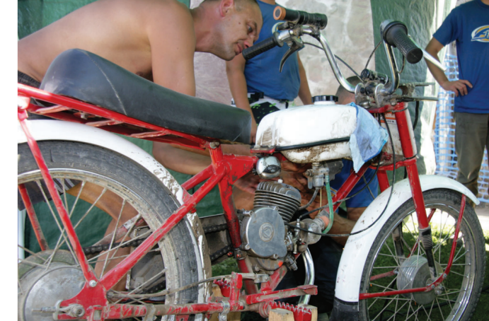
Нам удалось посмотреть одну из простейших каракатиц.