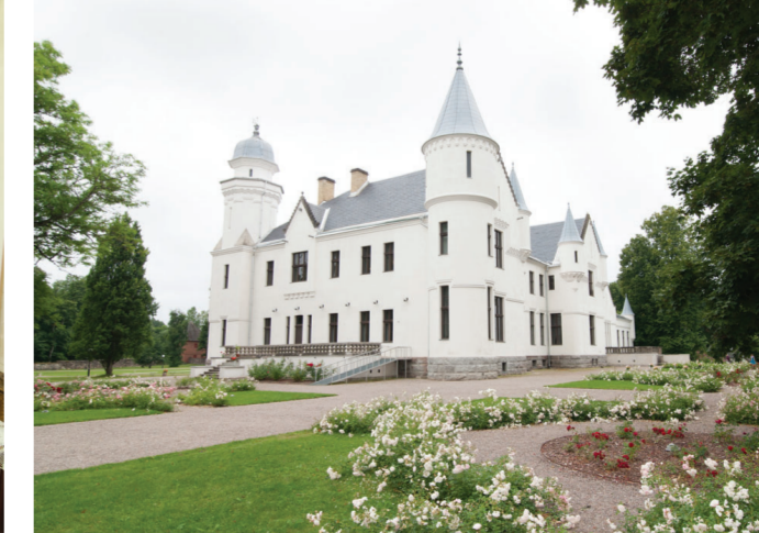
Замок баронов в Алатскиви - словно сказочный.