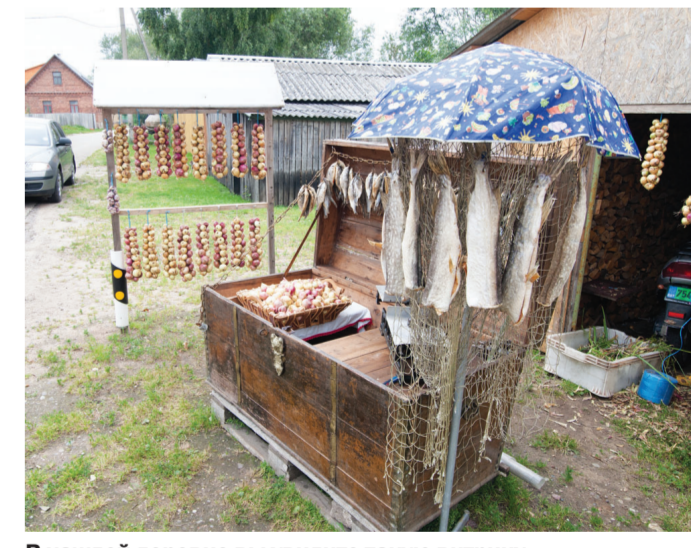
В каждой деревне вы увидите такую витрину.