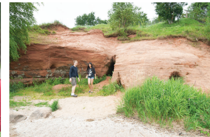
С утесом Калласте связано много древних легенд - например, поверье гласит, что когда-то в песчанниках была кузница самого дьявола.