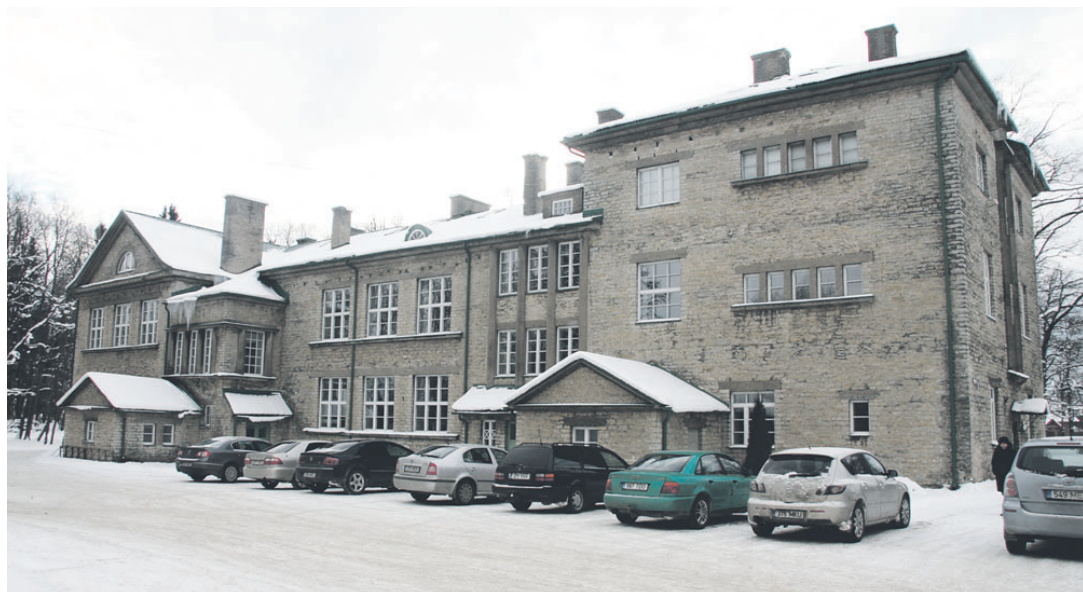
Люганузеская школа - старейшая школа уезда.

■ Люганузе, Пюсси, Кивиыли и Азери - о каждом из этих мест можно говорить долго и много, но две газетные страницы не позволяют углубляться в детали. Однако мы постарались перечислить наиболее значимые или интересные факты, которые, возможно, заставят пылкий ум заинтересованных читателей отправиться в эти места, чтобы получше их узнать.