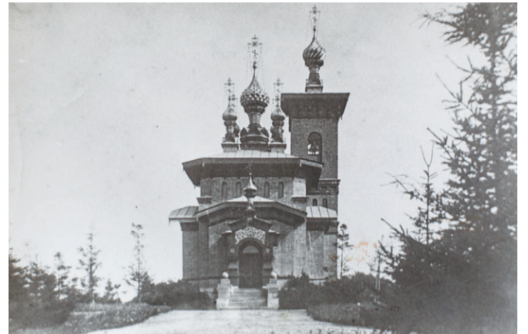
Церковь располагалась на пригорке к юго-востоку от дворца и была снесена в 1935 году.

→ ня, что доказывало интерес хозяина к лошадям и охоте. За манежем был большой огражденный стеной двор, где располагались людская и службы.