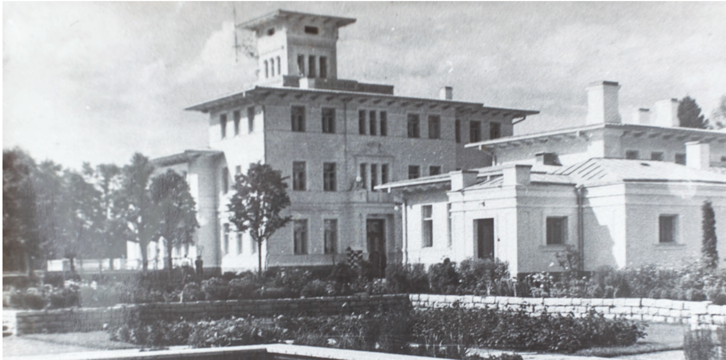
Елисеев воспринимал свой летний дом как дачу, но окружающие величали его дворцом.