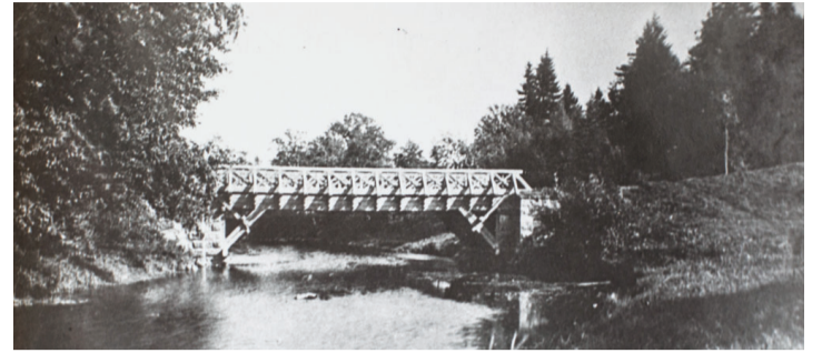
Мост через Пухайыги в период Константина Пятса.