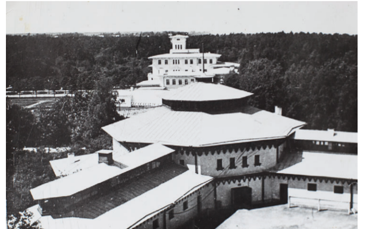
Манеж и конюшни в елисеевский период. На заднем плане - дворец.