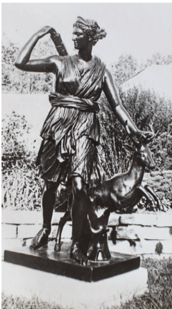
"Артемидо-охотница" в прошлом веке украшала парк.